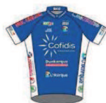
DUNKERQUE LITTORAL CYCLISME - COFIDIS TEAM