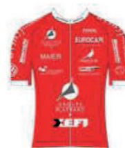
VC VILLEFRANCHE BEAUJOLAIS