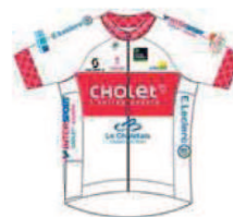
UNION CYCLISTE CHOLET 49