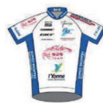
VELO CLUB DE TOUCY ELITE RESTAURATION