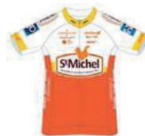
CMA 93 - ST MICHEL