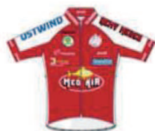
PE HAGUENAU - TEAM REMY MEDER