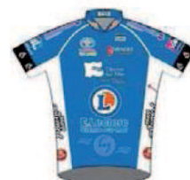
PAYS DES OLLONNES CYCLISTE COTE DE LUMIERE