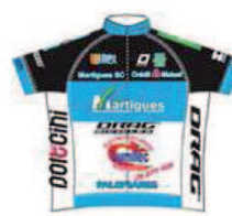
MARTIGUES SPORT CYCLISME