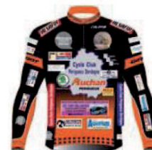
CYCLO CLUB PERIGUEUX DORDOGNE