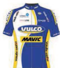
VELO CLUB VAULX EN VELIN TEAM VULCO