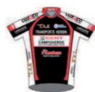
VCA ST QUENTIN