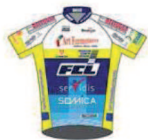
AMICALE CYCLISTE BISONTINE

SAISON 2018 - 22 ÉQUIPES de 6 coureurs soit 132 coureurs