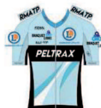
TEAM PELTRAX - CSD