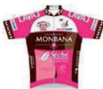
LAVAL CYCLISME 53