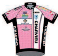
CHARVIEU CHAVAGNEUX ISERE CYCLISME