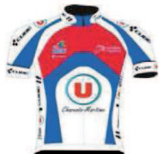
APOGE U CUBE 17