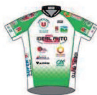
TEAM PAYS DE DINAN