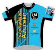
TEAM CYCLISTE AZUREEN