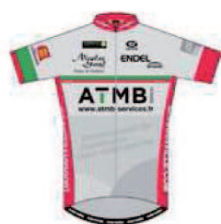
USSA PAVILLY BARENTIN