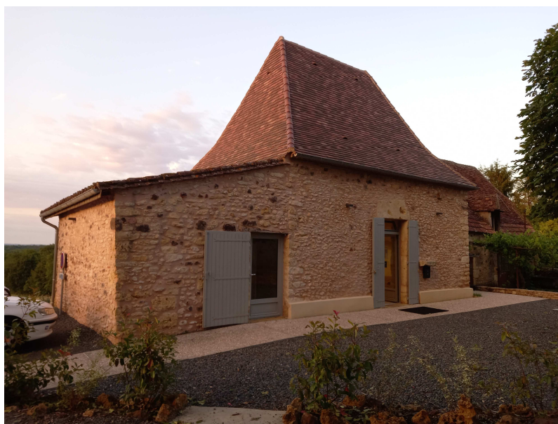
La maison du bourg à proximité du départ / arrivée

La permanence a lieu à la maison du bourg de St Chamassy et sera ouverte à partir de 12 h 30