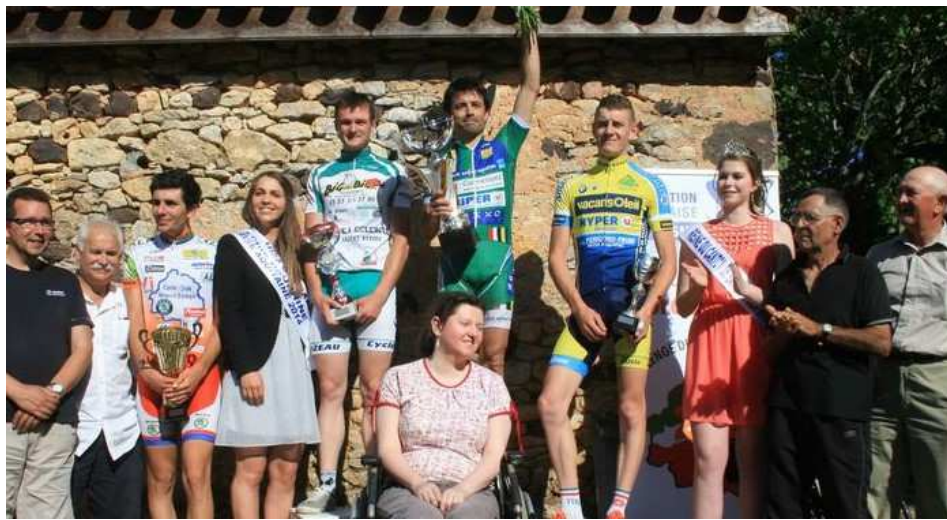
La famille du Cyclisme à St Chamassy en 2015

Cérémonie protocolaire : Les cérémonies protocolaires se dérouleront directement après l'épreuve au podium, à proximité de la ligne d'arrivée