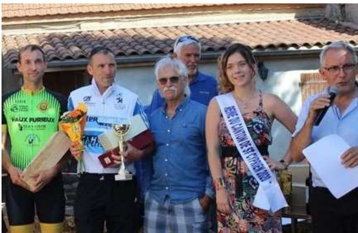
Podium de 2021