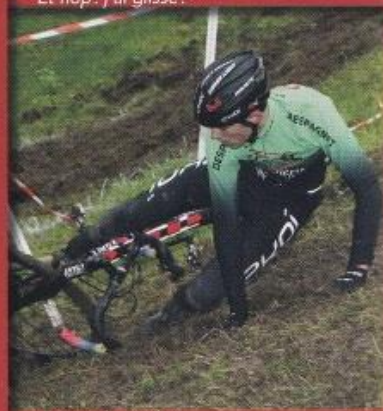
J'ai mis le pied...