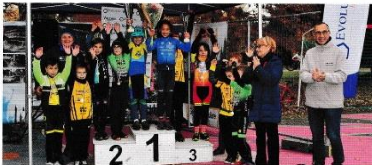
Podium U 11

Malgré un problème mécanique, le Tonneinçais s'impose.