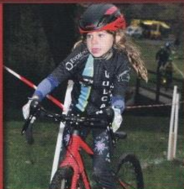
Ou'elle est belle cette victoire!