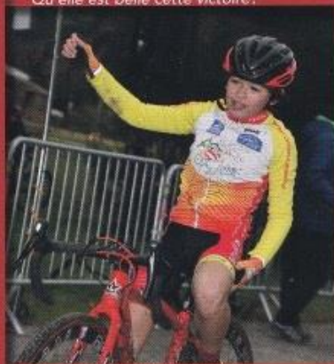
Tu as vu? ils ne suivent pas!