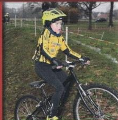
Et hop! j'ai glissé!