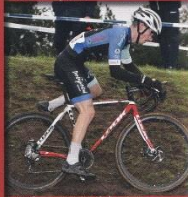
Ouf, une première de la saison.