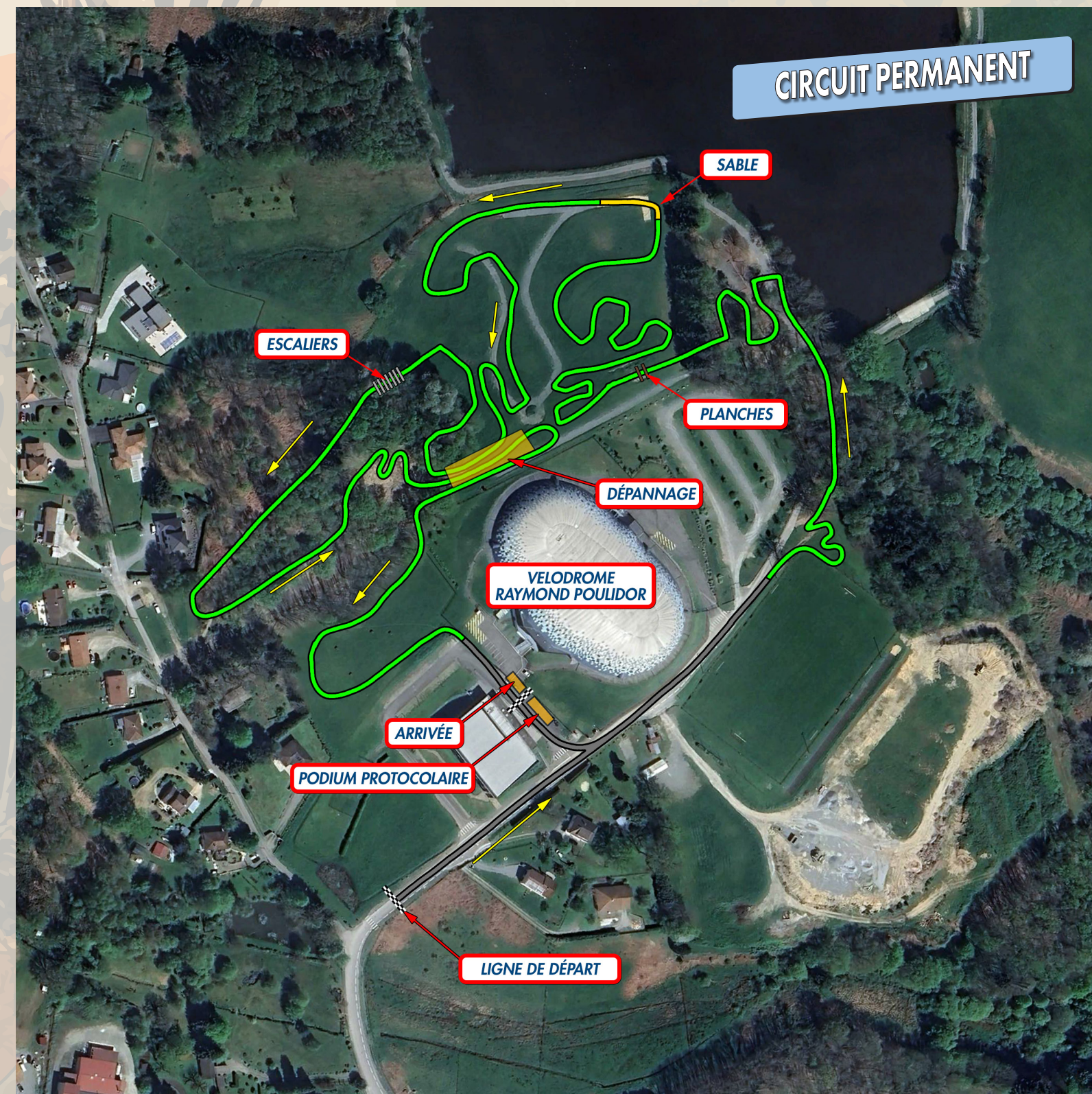
ARTICLE 8 : PLAN DU CIRCUIT - CIRCUIT PERMANENT ANDRÉ DUFRAISSE - SITE DU VÉLODROME RAYMOND POULIDOR